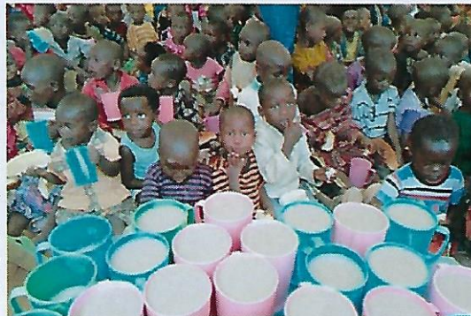
De pap staat klaar om uitgedeeld te worden

Een van de boegbeelden van onze projecten zijn de voedselprojecten. We zien veel (ernstig) ondervoede kinderen. Door ze twee keer per week een beker pap aan te bieden en hun moeders te trainen over het belang van gezonde, gevarieerde voeding en het belang van een kleine moestuin bij het huis, komen steeds meer kinderen op gezond gewicht. Helaas is het probleem nog lang niet opgelost, maar we zien dat deze aanpak werkt. Binnenkort hopen we een nieuw project te starten in Shara, dat mede mogelijk wordt gemaakt door de GZB.